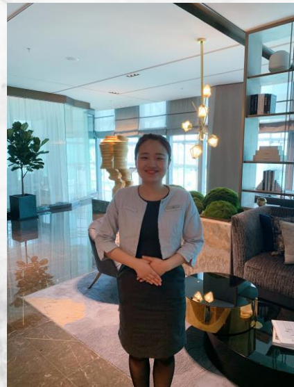
B栋7F-展示中心 流动服务岗