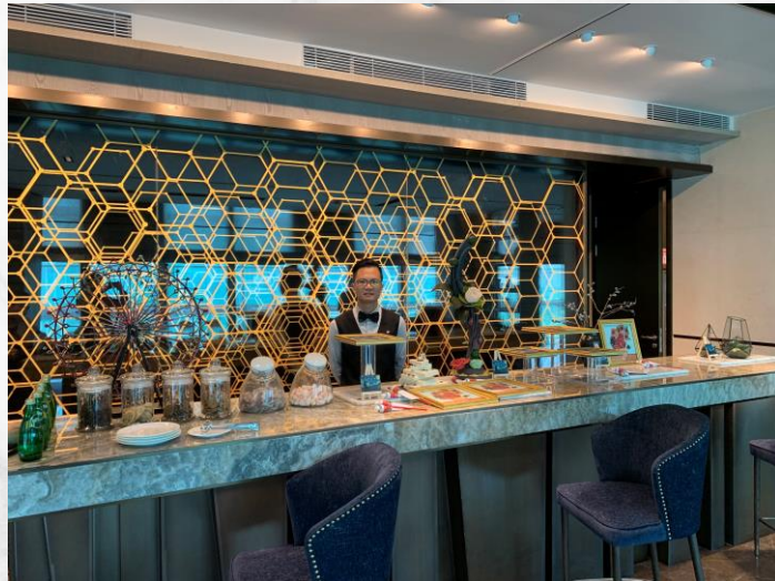
B栋7F-展示中心-吧台服务岗