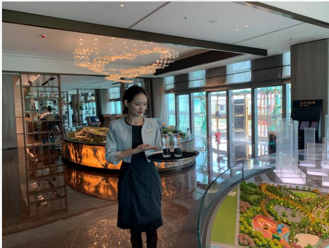
B栋7F- 展示中心-流动客服

【职能】客服在此时送上瓶装矿泉水，供客人饮用。之后回到靠近A艺术品附近，方便随时服务和指引客人。