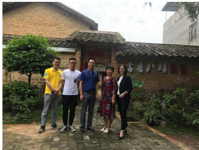
信宜市八坊校村共育人才培养基地