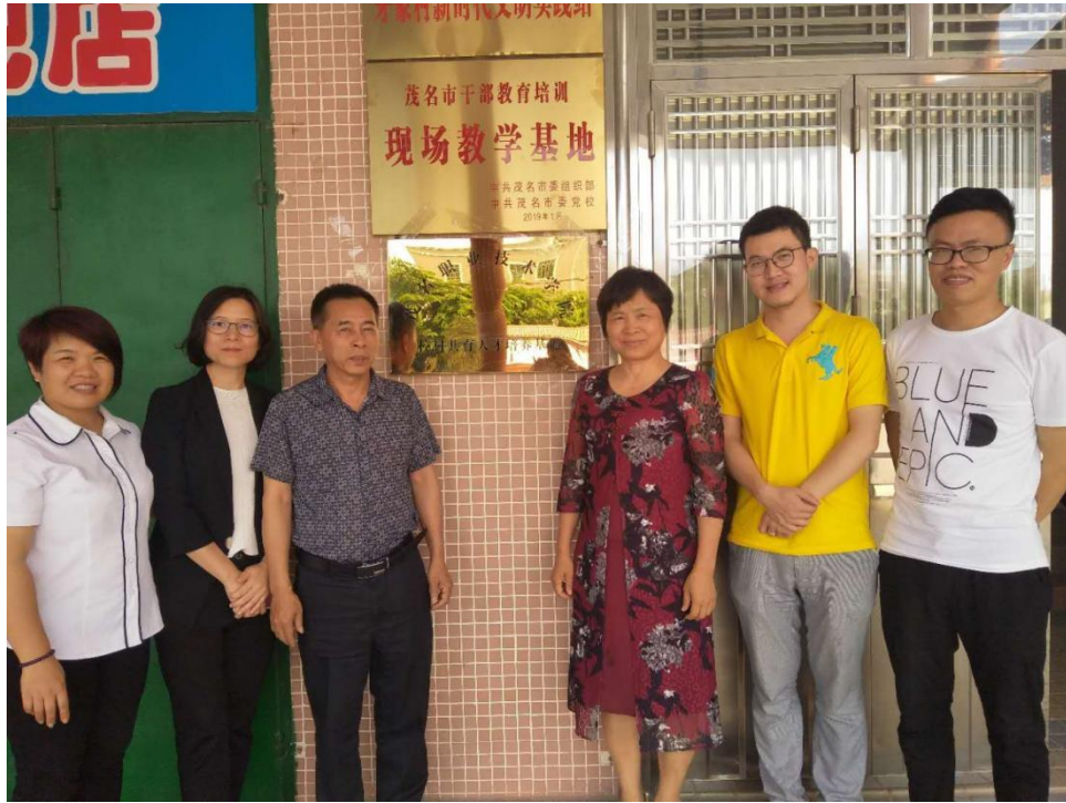
茂南区牙象村校村共育人才培养基地